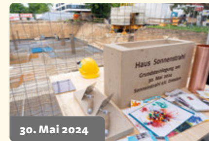
30. Mai 2024

Herausfordernd war es, Funktionalität mit einer warmen, freundlichen Atmosphäre in Einklang zu bringen. Durch die enge Zusammenarbeit aller Beteiligten fanden wir Lösungen, die beiden Ansprüchen gerecht werden. Dieser Prozess zeigt: Herausforderungen sind letztlich Chancen, etwas wirklich Besonderes zu schaffen.