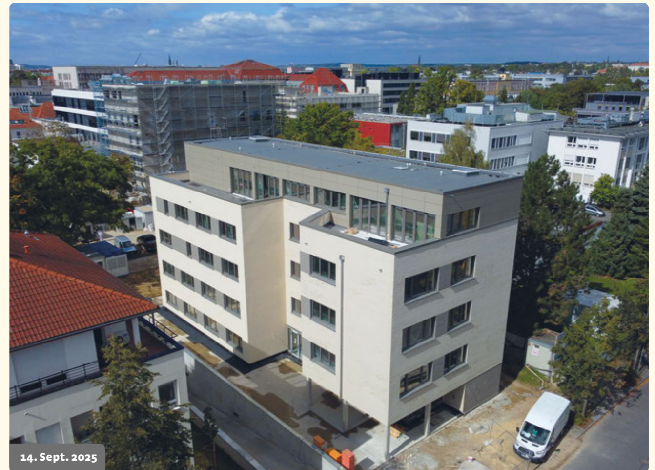
14. Sept. 2025

Das HAUS SONNENSTRAHL nach dem Gerüstabbau.