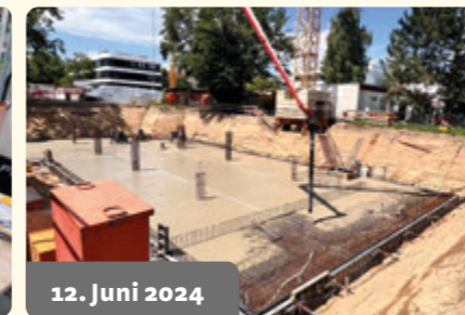
12. Juni 2024