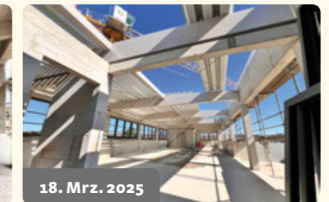
18. Mrz. 2025