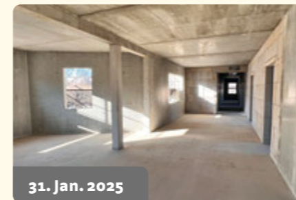
31. Jan. 2025

Die vierte Etage (3. OG) wird geschlossen.