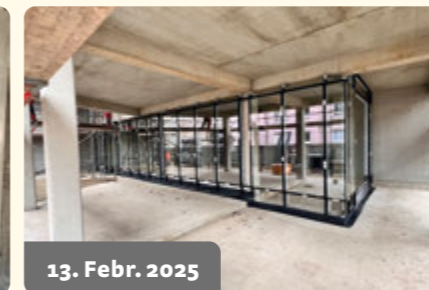
13. Febr. 2025