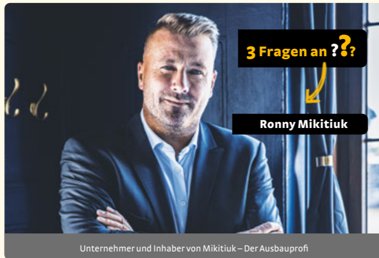
Unternehmer und Inhaber von Mikitiuk – Der Ausbauprofi

Mittlerweile steht der Neubau des HAUS SONNENSTRAHL kurz vor der Fertigstellung. Nach Monaten intensiver Bauarbeiten: Baugrube ausheben, Fundamente gießen, tragende Wände und Geschossdecken errichten, Klinkersteine vermauern sowie Kabel verlegen – nähert sich dieses wichtige Projekt nun seinem Finale. Im Dezember 2025 wird das Gebäude offiziell an den Sonnenstahl e. V. Dresden übergeben. Im Anschluss beginnt im Januar 2026 die Innenausstattung: Mit gezielt abgestimmten Räumen für Kinder und Familien: Der Sportraum fördert Bewegungsfreude, Selbstvertrauen und Selbstständigkeit der Kinder. Geschützte Räume für Musik- und Kunsttherapie unterstützen Kreativität und Selbstwirksamkeit. Die Vereinsbüros werden funktional eingerichtet. Im Staffelgeschoss entsteht ein offener Treffpunkt für Austausch und Gemeinschaft. Im Februar ist der Umzug von der Goetheallee in die Schubertstraße geplant. Mit dem neuen Haus gewinnt der Verein mehr Raum und neue Möglichkeiten, seine ganzheitliche Unterstützung für Familien krebskranker Kinder weiterzuentwickeln – in unmittelbarer Nähe zum Uniklinikum, mit Platz für gemeinsame Aktivitäten und Begegnungen.