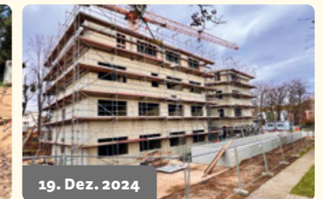
19. Dez. 2024

Die vierte Etage (3. OG) wird geschlossen.